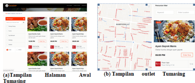
Gambar. 3. Desain halaman TUMASING

Setelah melakukan analisa, langkah selanjutnya adalah melakukan tahapan desain yang meliputi desain database dan desain form. Untuk desain form diserahkan kepada seorang desainer website dengan budget Rp 700.000. Tampilan desain tersebut dapat dilihat pada Gambar 3.