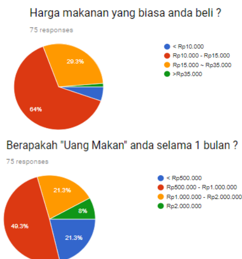
Gambar. 1. Hasil survey part 1

Survey ini dilakukan menggunakan bantuan Google Form.