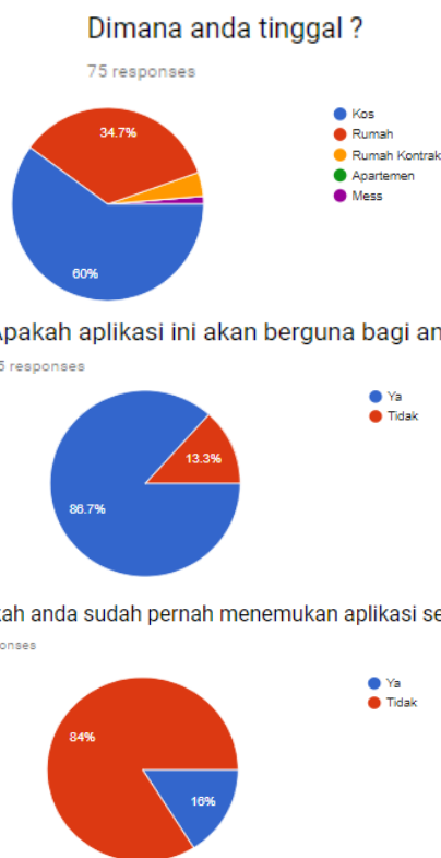
Gambar. 2. Hasil survey part 2

Kami pun melakukan survey terhadap pedagang kaki lima terutama penjual makanan untuk mengetahui kebutuhan dan keinginan dari pihak pedagang kaki lima. Survei telah dilakukan ke beberapa tenant baik restoran, depot, warung, ataupun catering. Dari hasil survey tersebut dibagi menjadi 2 scope besar tenant yaitu catering dan non catering. Catering diikutkan dalam tenant ini dengan maksud mendapatkan harga lebih murah (sesuai dengan survey terhadap calon customer, dimana rata-rata uang yang dikeluarkan untuk 1 kali makan berkisar Rp 10.000 – 15.000) sehingga dapat digunakan untuk penyedia makanan untuk fitur perhitungan budget makanan selama 1 bulan. Survei dilakukan dengan menemui 5 catering, namun demikian terdapat kesulitan bahwa sebagian catering menyediakan makanan dengan budget Rp 25.000/porsi, hanya 1 catering yang menyediakan makanan dengan budget Rp 10.000/porsi termasuk nasi, dan 1 catering yang menyediakan makanan dengan budget Rp 16.000/porsi (terdiri dari nasi putih dan 2-3 macam lauk) . Sedangkan untuk tenant non catering memiliki harga yang beragam yaitu Rp 18.000 – Rp 35.000/ porsi (hanya untuk 1 macam lauk).